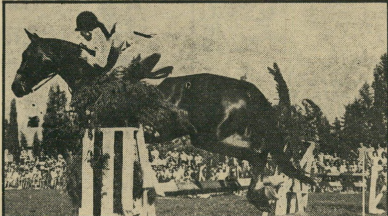
מתחרה ישראלית במעבר מכשולים ואדון גם יחד

בשבויעים האחרונים, היא: למה. למה עשיתי את זה? הלואי וידעתי. באמת שאין לי תשובה. הכסף? בפירוש לא, אינני משתמשת בו כל ההון שאני מרוויחה — 100, 200 ל"י ליום. אני סתם שמה אותו בבנק. למה אם כן? כדי לשכב עם גברים? גם כן לא. אינני נהנית מזה — לא מהצד של המספר. למעשה, אין לי בעצם היום חיימיין פרטיים משלי. הרבה מהבנות במקצוע, בייחוד הילי דות, נכנסו לזנות בגלל בעיות בבית. בדרך כלל — וגם רוב הפסיכולוגים מסיימים עם זה — הן נוקמות בדרך זו ב"הורים. אני חוששת שאפילו סיבה זו לא קיימת אצלי. אינני רוצה לנקום בהורי. זאת גם הסיבה, אגב, שאני לא מוכנה להצטלם בגלוי ולתת את השם שלי. כדי לא לפגוע בהורים ובמשפחה. לולא הם, לא היה איכפת לי. בשבויעים הקצרים האחרונים, כאילו איבדתי את כל עולמי שרכשתי לי ב-19 שנה. לא איכפת