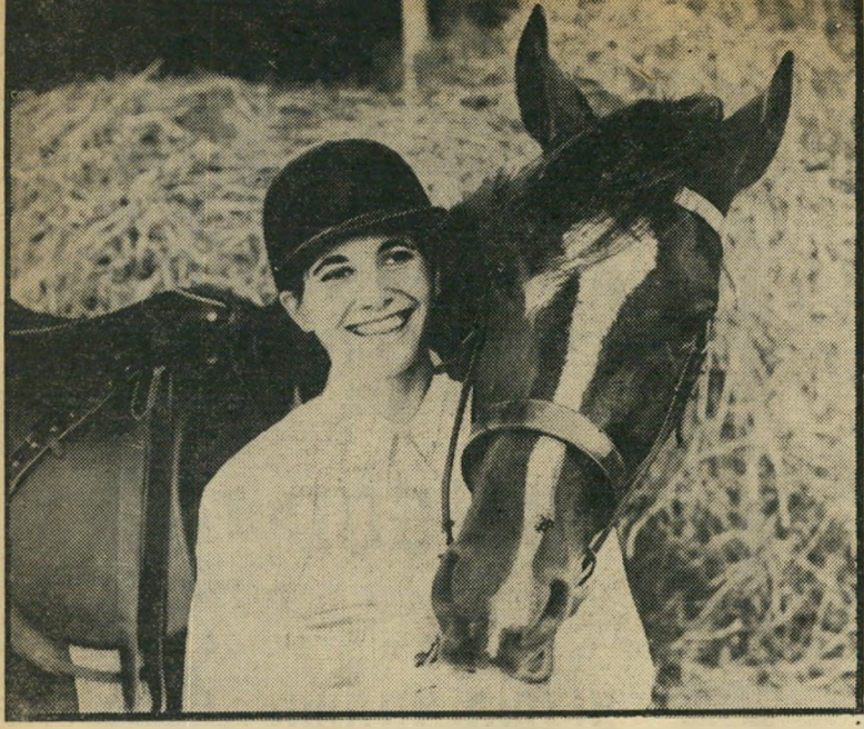
גיין וגל, לאחר הניצחון אך להיות חבר —

נחיתות בולטת. במרכז של הסדר סיה, שנמשכה יומיים וכללה תחרויות שונות לנוער ולמבוגרים, עמדה התמור דודת במכשולים בין נבחרת ישראל לנבחרת חילהאוור הבריטי מקפריסין. בניגוד למירוץ הסוסים, זכו קפיצות המכשולים לתשומת-לב מקצועית בארץ רק בארבע השנים האחרונות. מבחינה זו, נמצאה הנבחרת הישראלית בנחיתות בולטת לעומת הרוכבים הבריטיים.