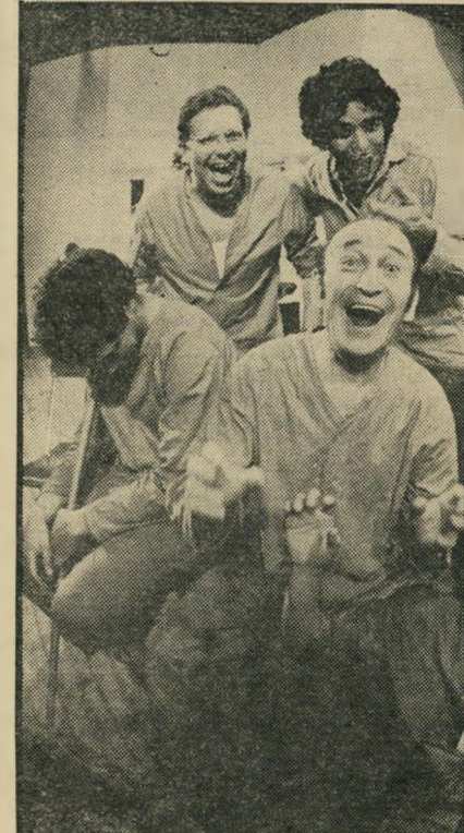
"ברוך למוסד הסגור" * כתב אישום

אבל מי שרוצה, יכול בקצת דמיון להשלים את התסר. האחות ראשד היא הגיבורה הראשית של מחזה-ביעותים זה, שנכתב במקורו ככיצירה ספרותית תעודית למחצה, של מי ששימש כאח במוסד לחולי-רוח. היא השליטה הבלעדית על חייהם וגורלותיהם של חולי הנפש הכלואים במוסד. שהי חיים בו מתנהלים כביכול על פי שיטה