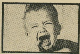
אני לא מסכים שישכנו אותי