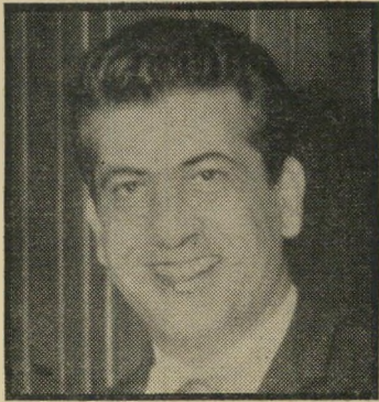
בני יודיה כולם אשמים

|"העולם הזה" 1814, "מי אחי-ראי" לכישלון בלוד. בטבח הנורא במלחמת-העופה לוד אשמים כל אזרחי המדינה, כולל ראש-הממשלה ושר-הביטחון השיכורים עד היום מניצחונות המלחמה. אמצעי הביטחון התדרדרו. בארץ הסי תמכו על אמצעי זהירות של חברות תערי פה זרות. איך זה שאף אחד לא חשב שכדאי להציב מכוונות לבדיקת נוסעים