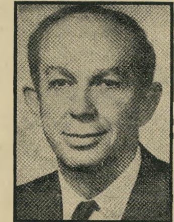
ציר לשעבר עברון

ב „גוריון חיבב את רבין, אותו כינה „העילוי“, באופן אישי. הוא היה בין אלה שניבאו לו עתיד מזהיר. כידים הא־שי של הוריו — נתמיה רבין, מאנשי הגדודים העבריים במלחמת העולם הראשונה, ורווח כהן, עסקנית פועלים שהיתה חברת מועצת עיריית תל־אביב — העריך ביג"י את רבין ואת כשרונותיו. צריך גם לזכור כי היה זה יצחק רבין שמילא אחר הוראתו של בן־גוריון ופקד על „התותח הקדוש“ שירה באוניית הנשק של האצ"ל אלטלינה.