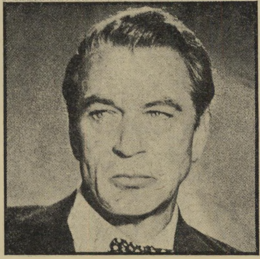
גארי קופר: "ואזי ידבר דינאמיט?"

שמעתי במיראזוני חבריכנסת מדבר בעם ובתיעוב על "בית-החולים הנוצרי שעל הרהיבותים", כשהדגש על