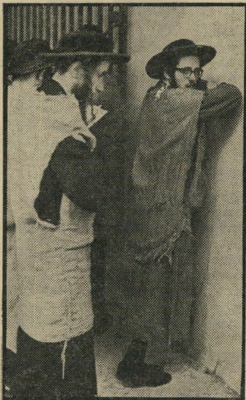
איזו פוזה! מפגינים חגורי שק מתפללים בפתח, מציצים לעבר הנכנסים פנימה.