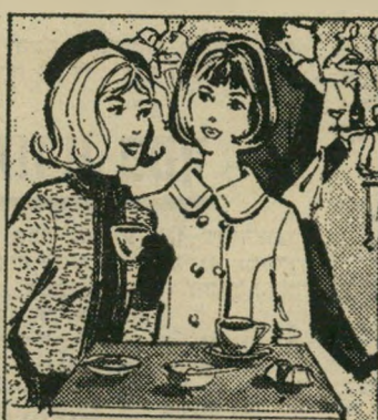
לא נעים להגיד, אבל זהו רית-פה... קחי תיאדנט!