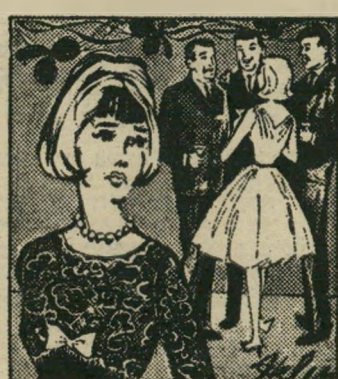
אז למה, אין איש קרב אלי? ...אז למה, אין איש קרב אלי? אז למה, אין איש קרב אלי?