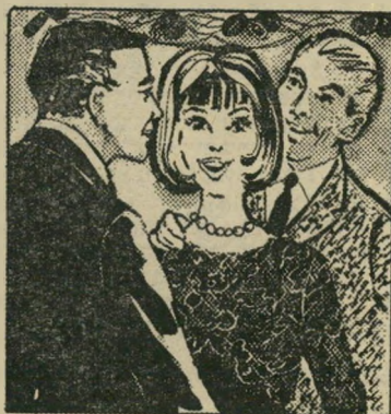
הפגי אַנְדֵּם תיאדנט