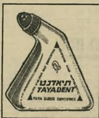
סיפוח פלא תיאדנט, נפלאות לשטיפת הפה, או על מברשת לחה לצחצוח השיניים.