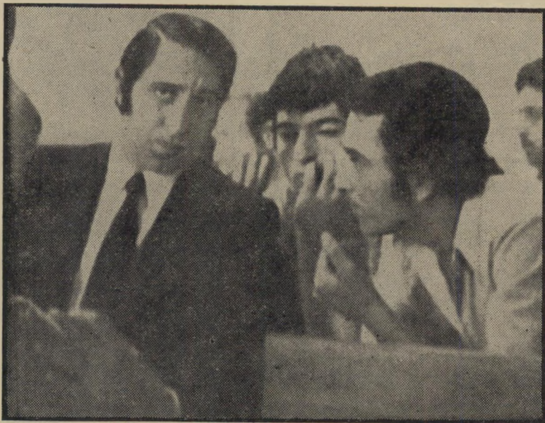
עצורים איבשץ ואוהיון וסניגורם שיטות מודרניות להפעלת ציוד קשר

שלא נותרה אגורה בכיסו. הוא השאיר את ציון המנומנם על שפת המידרכה, חזר לאתונה ללוות כמה לירות מידידים. הוא היה בדרכו חזרה לציון, כאשר שמע את הצעקות.