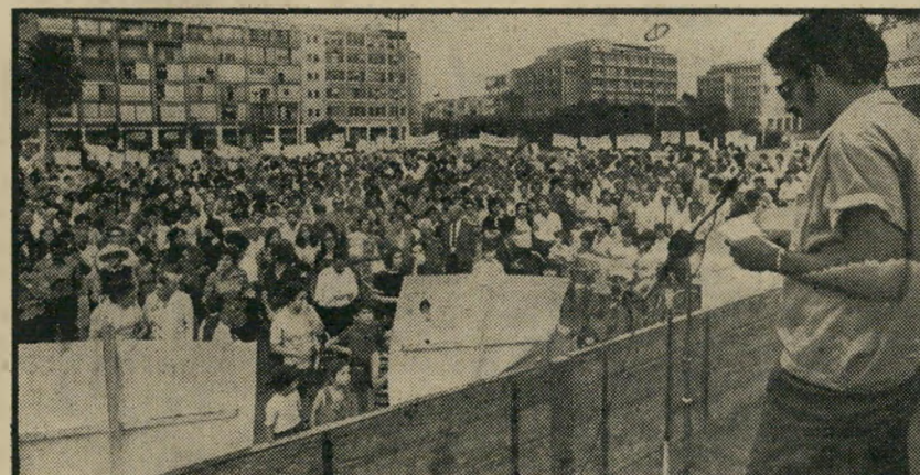
עורך ליפשיץ נואם בעצרת-השלום * "כמה עשרות צעירים..."

כאשר נודע שהמשביר המרכזי רכש ב-דינגוף סנטר — תמורת מיליוני לירות