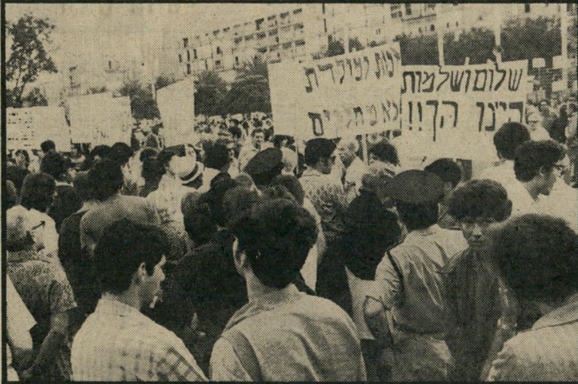
סיסמאות ארץ-ישראל השלמה בעצרת השלום "אין הכדל בין ארץ-ישראל השלמה ופלטטין המשוחררת"

— אולמות רחבי-ידיים, כדי למקם בהם בכוא הזמן כלבו חדיש, עורך הדבר מור-רתורה גלויה בוועד-הפועל של ההסתדרות. הסיבה: מצבו הכספי של הקונצרן ההסתדרותי, שמניותיו מוחזקות בידי ה-התיישבות העובדת, אינו בכי טוב. ביטוי לכך ניתן היה למצוא בגליון ה-חדש של ביטאון עובדי המוסד, מבוע. שבו נאמר בין השאר: "רק אם תימצא הדרך להבטיח מימון נאות לפעילות המס-חירת השוטפת, ורק אם ילמדו קברניטי המוסד לנהל מדיניות נבונה במישורי ה-מלאי, ההשקעות וההוצאות האחרות — רק אז אפשר יהיה להבטיח רווחים בסוף השנה."