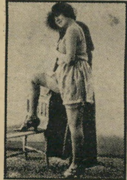
בא דך? אז יללה!