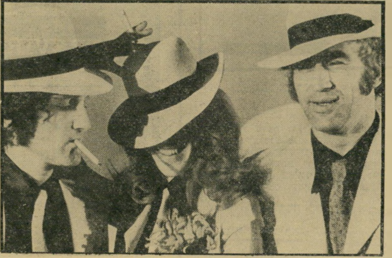
אמדורסקי, כ"ץ וגוריון מרלן דיטריך וגרטה גארבו

הנוסטלגיה אוכלת אותנו, אבל בעיקר היא אוכלת את הפיזומוני-שדרן-מתרגם