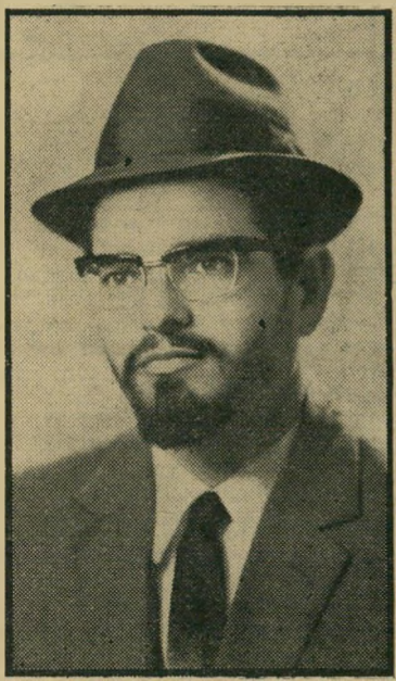
ראש מועצה מקומי

קטפו את אשתי, התפרץ גבר נמוך-קומה לתחנת-המיטרה בראש העין, "אני יודע מי עשה לי את זה. הגיס שלי ימח שמו, את אשתי והילדים לקח!"