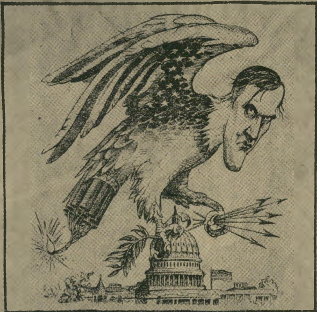
He was only President of the United States. But he planned to work his way up.