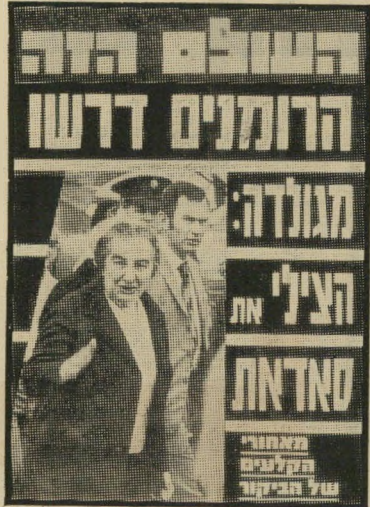
השער המתוכנן לגיליון 1810

גירסה היתולית זו משקפת את אחת הבעיות נגדן אנו מתייצבים כמעט מדי שבוע: בעיית פער הכיסוי. כל שבועוני החדשות בעולם מתלבטים בבעייה זו, הן נובעת מכך שצורת הייצור של שבועונים היא שונה, מבחינה טכנית, מזו של עיתונים יומיים. כיוון שבדרך-כלל מודפסים השבוע