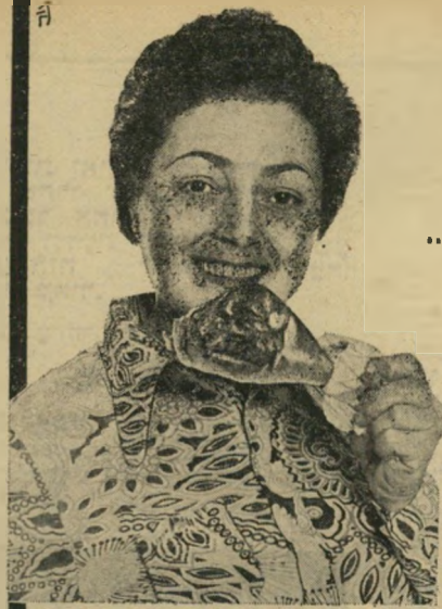
אשת-חיל פולקע' מצאה...

אולם התוצאה היתה הפוכה — ואפשר היה לנחש אותה מראש. הסנסציה העלתה את הפלסטינים לחדשות, אך רק לשעה קלה. חוסר-הכישרון של החוטפים, הצלחת הישראלים בשהיה-הקרב שנבחר על-ידי הפידאיון עצמם, וההתבטאויות העלובות של החוטפות אחרי שנלכדו — כל זה הוריד עוד יותר את קרן הפידאיון, וכי-עקסין את קרן הפלסטינים כולם.