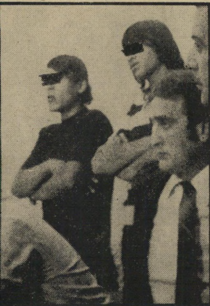
גונבי האופניים הממונעים תנו להם טוטוטוסים

מימצא אפסי. להפתעת הכל נראה כי השופט התרשם מדברי הנאשם ואף האמין בהם. "תגיש תלונה נגד השוטרים שהיכה אותך," הורה לנאשם. "אני לא יכול לדון בו משום שאינו נמצא כאן. אך שמעתי לאחרונה על מקרים רבים דומים. "שמעתי על ילד שהתלונן ששוטר עצר אותו כשרכב על אופניים וקרא לו גנב.