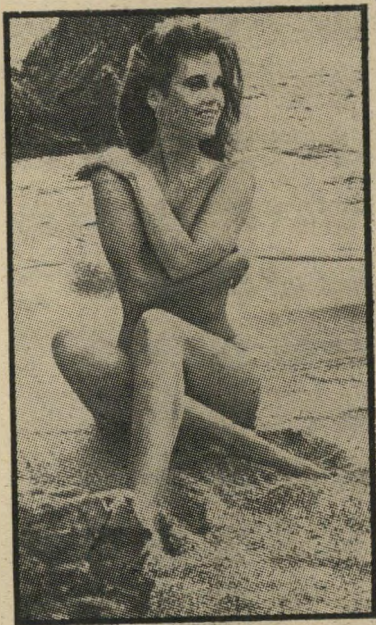
פונדה מעורטלת — את הקאריירה?

מדור תמרורים האחרון שלכם הרג אותי לגמרי. כשגמרתי אותו בכיתי ממש בכי