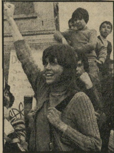
פונדה משוחררת מה דוחף יותר —

אני לא מסוגלת להבין את הנשים המשוחררות האלה. למה צריכה אשה להפגין את עצמאותה דווקא באגרסיביות כלפי המין-הגברי או בשלילה מחלטת של מוסד-הנישואין? מה תעזור לגברת לאה