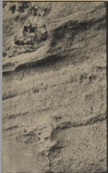
כפחד על התהום נופל הצל

בצה"ל היא קיפלה מיצנחים, בפא"ר יס היא כתבה שירים. היא היתה קיבוצניקית, ולמדה בסורבון בפאריס. אבל הכי מעניין היה בארצות-הברית, שם היא התחנתה עם מישהו, בלי לדעת בכי לל, כשהיתה בטריפ ל.ט.ו. "זה היה לפני שבע שנים", היא מסר פרת. "נסעתי לארצות-הברית. אז רק התחילה שם האופנה של הל.ט.ו. במסיבה