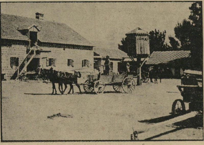
דגניה 1914 - חומה ומגדל 1938 - מי ישב קודם על אדמה זו?