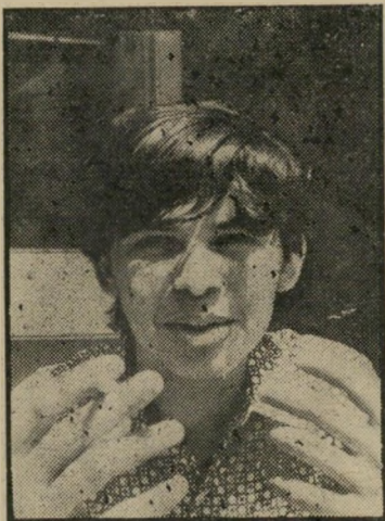
יהודי ע"ד תנאי טינג יהודי אבל...

נפלה טעות. נאמר שם כי כתבתי שאני יהודי. נוצר אם כך הרושם שאני מנתק עצמי מכלל האומה.