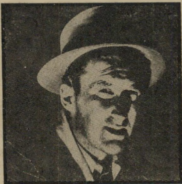
מייק ספיליין הכל ורוד

מיקי ספיליין, כפי שידוע לרבים, הוא האיש אשר הכניס מהלומת-אגרון בפני כל קוראיו בתחילת שנות החמישים. ב"סידרה של ספרים נוקשים ואלמים, אשר שברו שיאי-מכירה בארצות-הברית. מאז יודעים הכל שמייק האמן, גיבורו של ספיליין, הוא הברגש הקשה ביותר בעולם, זה שדורך על גוויות, רומס פוש-עיים, כדור בקרביים אינו עוצי אותה, וכל הנשים שופעות-האברים (ודא פוגש רק כאלה) אינן מצליחות להחזיק את דעתו, אלא לפרק זמן קצר של מישגל, מן ה-