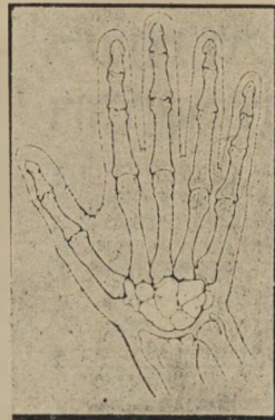
הכפנים של היד