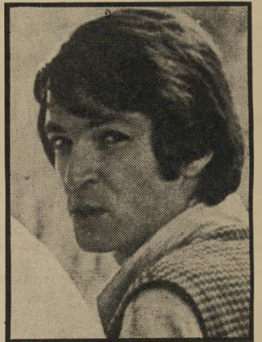
אריק איינשטיין הכל רבעי פרחים