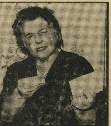
מפיקה קלאונר טלריוויז + 2100 ל"י

ד"ר ריצ'ארדסון הוא האיש שביים בארצות-הברית את בוננזה, משימה בלתי אפשרית, ארגן, הסנגורים, היו צאי פארל, בסך-הכל, ביום 636 מחזות וסידרו רות טלוויזיה, השבוע, ראו אותו גם ב-