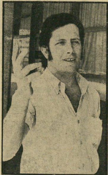
אחרון צור „נמשך להילחם“

„לא חשוב.“ משיב עווי. „אנחנו עוד צריכים לעבוד עם האיש הזה.“