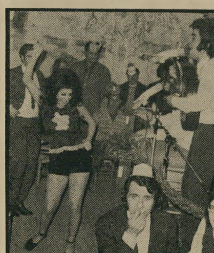
ישראלית ומצרי ב"ארמון השלום" בעד השלום

נבחרתם עליידי מבקרי ארמון השלום לייצג אותנו באשר לרעיון השלום באזור-