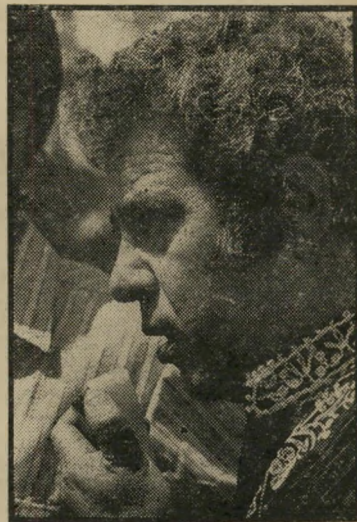
קינן בעצרת המחאה. אני מתחיל לפקפק

בפיתחת-רפיה קרה דבר פשוט וברור-טאלי: אוכלוסיה בדווית, שישבה על-