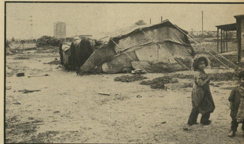
יודים בדווים בנוף של חולון — היו בלוף

מסביר הדובר את המכתב: „הם לא רועים שום עדרים בגינות-ציבוריות.“ הוא