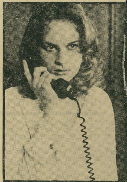
שחקנית דומיניק סאנדה כולם התברגנו

לעומת זאת, אחרים מכירים אותה היי טוב, או לפחות את פניה. שמה דומיניק סאנדה. היא נערה עצמאית, בעלת אופי חזק (אחת המעטות שלא פרצו אף פעם בבכי היסטרי בסרט של בראסון). המקי בלת את הצלחתה בשוויון-נפש גמור, מר כנה לומר בפה מלא שאין אפילו במאי אחד מבני ארצה שהיתה רוצה לעבוד עימו, משום שכולם התברגנו עד לשד עצמותיהם, וחיה בגלוי עם השחקן והי