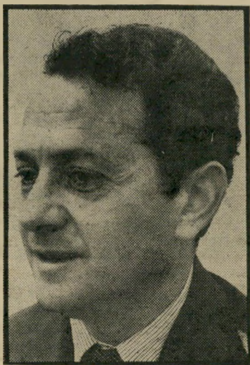
מנחה החדשות גיי כלי שרת של המימסד

המראה ארוכה. במקום לראות כתב בות שדה יוזמות ומצולמות, שומעים מאות אלפי הצופים מדי ערב, הצהרות מדיניות, הכרזות, תשפוכת של נאומי צביעות והתחסדות, הסברים, כנסים, ועיי דות, טקסים ממלכתיים, טקס פתיחה, טקס סיום, טקס חילופי שרים.