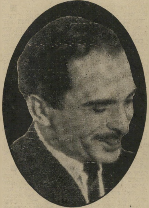
המנכ"ח חוסיין דגל בלי ריבונות

● הרצון להתנחל בצפיפות בכיקעת-הירדן. רצון זה בוטא מייד אחרי המלחמה על-ידי מנהיג הקיבוץ המאוחד, יצחק טבנקין המנות, אחרי שאנשי הקיר-בוץ נוכחו לדעת שהביקעה היא החלק היחיד של הגדה המערבית הראוי לעיבוד במכונות מודרניות, ושיש בו מים.