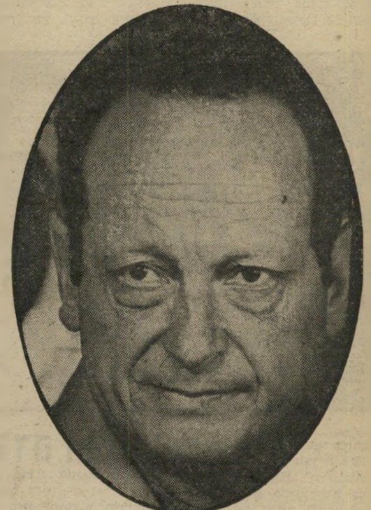
יגאל אלון החזקה בלי סיפוח

זוהי המפה החדשה של ירושלים, המתגבשת עתה במועל באמצעות השיכונניציה, והמצטרפת לתוכנית אלון. רצועת-השיכונניציה, נים בצפון מובילה מנביסמואל עד הרהצופים, ובדרום מבית-לחם עד ארמון-הנציב. בין שתי הרצועות, לאורך כביש יריחו, נשארה מירצה, במקום שיאפשר בעתיד גישה ירדנית להרהיבת, שעליו יתנופף הדגל הירדני.