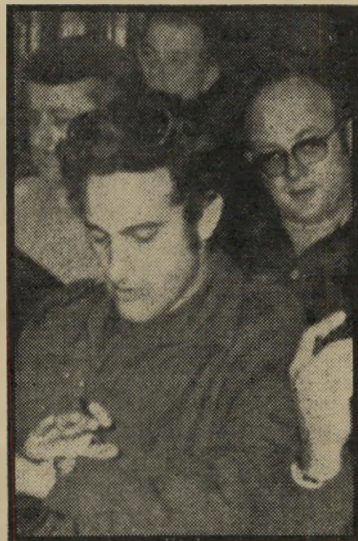
כתב-צבאי ביישי נזיפה לצה"ל

שעה שהמלחמות עם הפידיאון הערבים בגבול עדיין נמשכו, התנהלו מלחמות