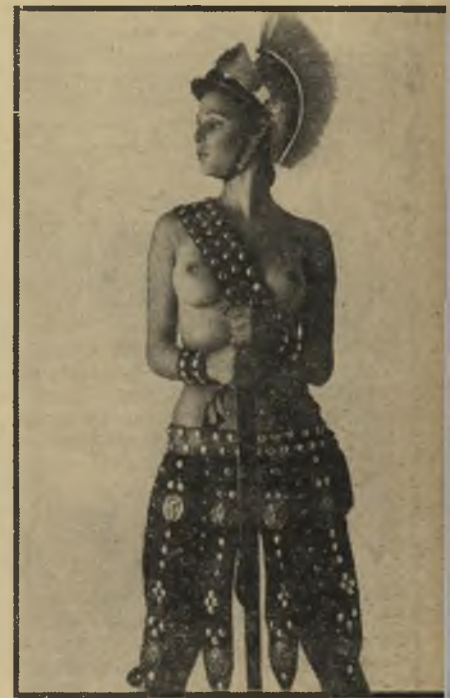
הקלסה. כליגורית רומאית, עושה סטלה רושם נוראי ביותר בהבעתה הקישחת.