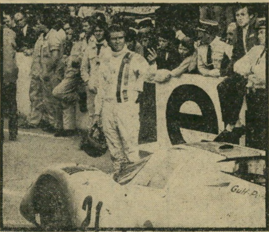
מקווין: התפקיד הריק ביותר

השעשועים). פה ושם, אפשר למצוא כמה קטעי מירוף מרתקים, בעיקר לקראת סוף הסרט, המיפלצות הדור-חרות על המסלול עושות רושם לא מבוטל, ובכלל זה יכול לעורר ברבים את הנוסטלגיה למה שראו פעם באירופה, אבל לא זכו לראות באשקלון (ואפילו לא בקולנוע "הוד").