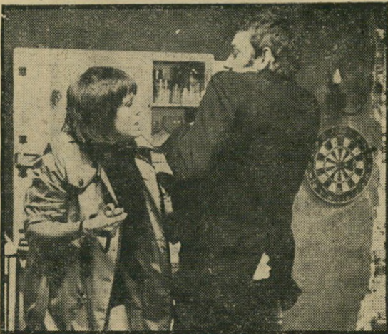
סאתרלנד ופונדה: הלקוחות של הזונה

חה, בצורה משכנעת מאוד, ודונאלד סאתרלנד, המגלם ספק בלש וספק קדוש, מקרין מידה עצומה של אנושיות. בעזרת שני אלה, נראה הסרט מגובש יותר, ובסופו של דבר מתעלה מעל הממוצע.