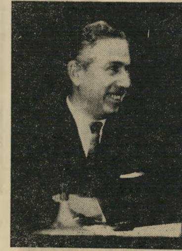
שר לשעבר נוסייבה מעל לראש

למאות אלפי צופי הטלוויזיה, דמתה ה-י שיחה לתחרות-סייף, הרבי-אומן הערבי, אנוואר אל-נוסייבה, התגונן בקלות, הדף כל התקפה. הסייף של המראין לא הת- קרב אליו. כנאה להתחרות ספורטיבית, נעשה הכל באלגנטיות עילאית. כנאה ל- איש שהיה שר-ביטחון, עורך-דין, קבלן בינלאומי ושגריר בלונדון.