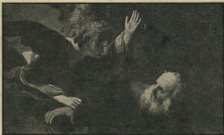
(ציור של רמברנט)

אולם מאז — השמש זורחת ושוקעת, והירח עולה ויורד, ושום דבר בארץ הזאת