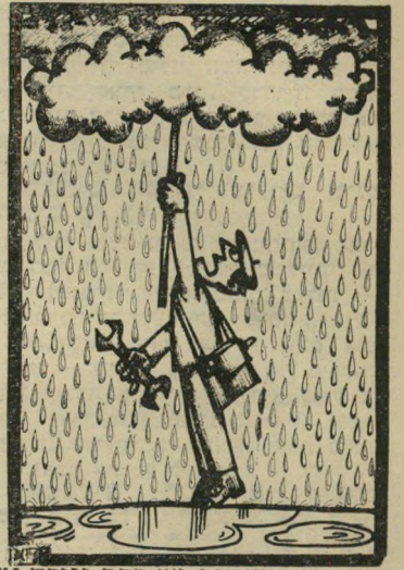
"היי שם למענה! יש לכם נזירה!"

גולדה היתה הצלחה לכל הדיעות, ולאיוה צורך בא המאמץ לתקנה? נסיון מוגבל. הסביר רוזנבלום בהמ