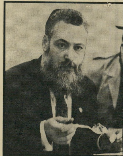
ציר צרפתי לקונגרס והחמשיך

לקונגרס הציוני דומה לחווה מדינת היהודים. הרצל. אינני רואה כלל את הדמיון. אלישבע חילוש, בני-ברק.