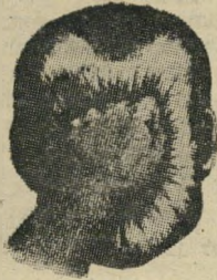
חטף זן לפרצוף

מתוך המהדורה הראשונה של 5,000 ספרים - נשארו 2 ספרים בחנות, "ירדן" ברח' יפו 42 בירושלים. 7 ספרים נשארו בחנות, "מסדה" ברח' אלנבי בת"א ו-3 ספרים בחנות, "הדר" ברח' הרצל 15 בחיפה.