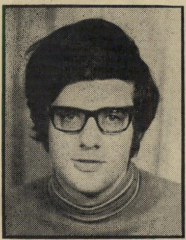
מועמד מלצר — בלי להשיג רוב

Merci לאשה שאיננה מוכנה להסתפק במועט גרכונים · נמישוים ארכונים · אקסטרונים בסריגת מיקרומש מאריכת ימים