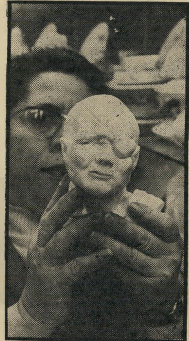
דיין מאבקת-שייש, ב-26 ליי. למטה: מחימר צבוע, ב-16 וחצי ל"י בלבד. הולך כמו לחמניות, לדברי המוכרת.

ה גם מסביר את הרמה הקיטשית הרבה מבהילה של מרבית מוצרי תעשיית הר נכס הלאומי. היצרנים ערים כמובן לטעמו של הקהל המבקש סחורה זו, ונותנים לו בדיוק מה שהוא אוהב. זה — אשר לקהל הישראלי. שוק ענק אחר למזכרות דיין הם התיירים המגיעים