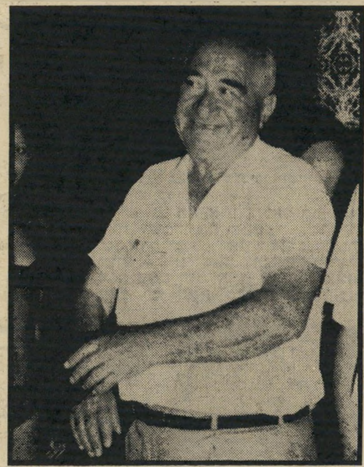
ח"כ סורקיס גיהינום

סיכום כהנאה אחד מראשי מפא"י, ממתנגדי דיין: "מי שיש לו ידידים כאלה, אינו זקוק לאויבים, לא בהעולם הזה ולא בעולם הבא!"