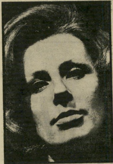
ווידה מרוסיה, באהבה

אבל כאן טמון המוקש העיקרי: לא כל עולה — עולה על הממוצע החובבני. וכזוהי בדיוק רמתו של החלק הראשון בתוכנית הבידור החדשה עולים עלינו, כשעולים עלינו צמד מתורכיה וזמרת מ-קנדה, שאינם משאירים שום רושם מיוחד. אחריהם עולים עלינו ארבעה טיפוסים חייכניים, שכבר נהרו לעצמם שם ישר-אלי, רביעיית מיתרי-החלב, ופורטים על צנגו וגיסרות. כמוהם ישנם אלפים ב-ארצות-הברית, אבל רביעייה אחת כזאת בארץ לא תזיק לאף אחד, מה עוד שהיא תרבותית להפליא בהשוואה למנחה של