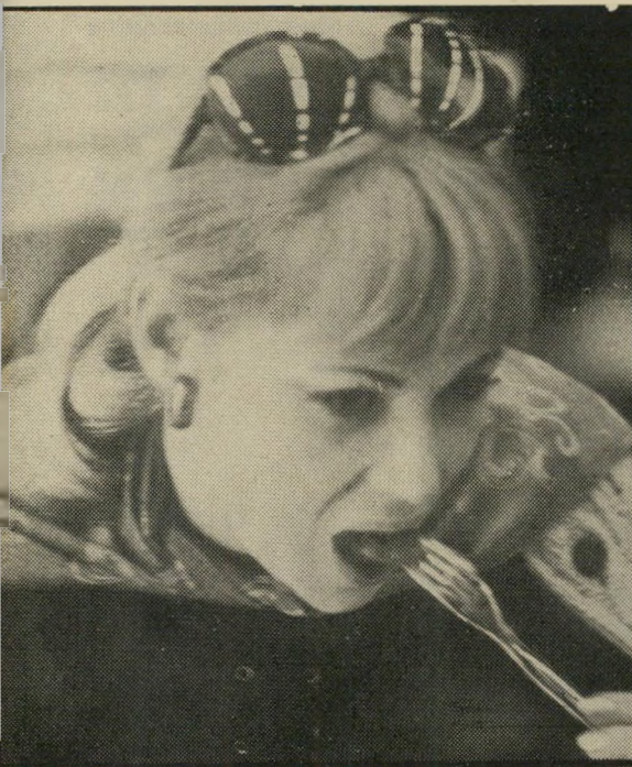
"בעלי לא מרשה" קבלה בלוני-דית צעירה, בעלת תיאבון ועדויות תכשיטים, כשהיא מסבירה את סיר-רובה להצטלם, לדבר, ולהשתתף בכל פעילות אחרת.