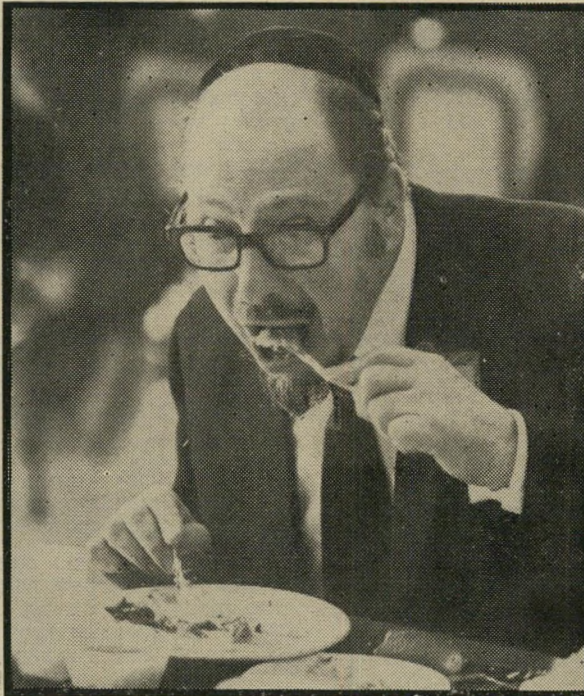
"יש שיפור" מציין רבה הראשי המזוקן של אירלנד. "זה לי הקונגרס השלישי. הראשון היה בשנת 1951, ואז היה בלגן עצום. אין מה להשוות למיתרחש כיום בקונגרס."