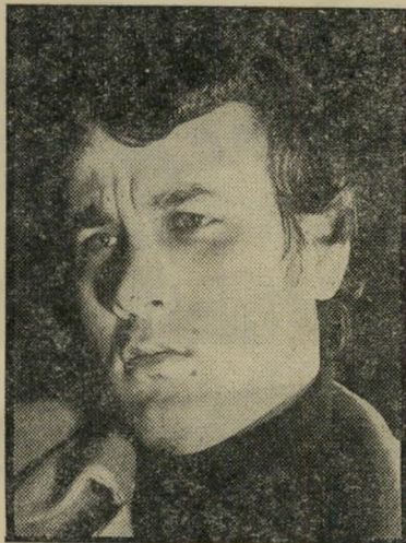
אופנוען ליפשיץ נגד סיריליה על הראש

בראש המכתב היתה מילה אחת בלבד, כתובה בע"עורכים כחול: לגנו.