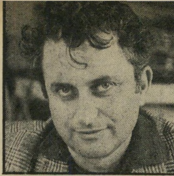
ראש עיר ברזילי סערות בעיר רדומה

העיר, וסגל שותפו הפעיל. קרן צבי התקומם, אך נאלץ להיכנע כאשר הקבלן לא ויתר. לאחר מעשה, שלח מכתב תלונה למועצת העירייה, על