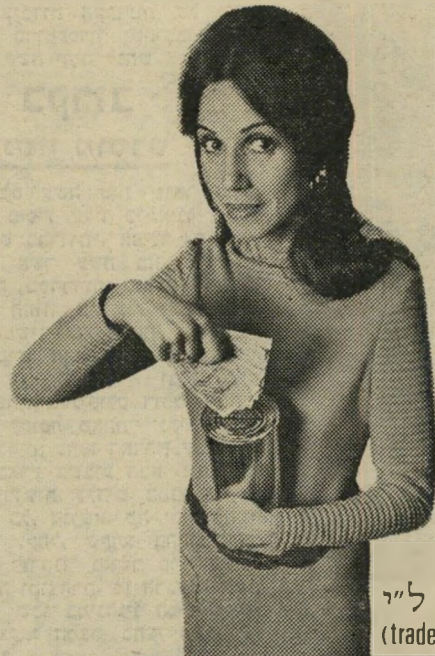
מבחר דגמים החל מ-1392 ל"י נמכרת גם בשיטת החליפין (trade in)