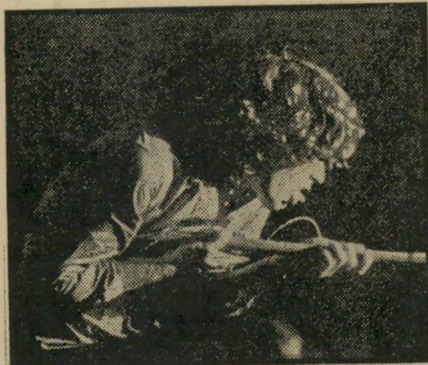
ג'ים מוריסון מנוח וגם נינוח

בלי אמצעי-העזר האלקטרוניים מחו ללי-ההדים, עם זמר קצת יותר נמרץ, ועם נגנים קצת יותר שחומים בעורם ושופים בנישמתם, אפשר ותקליט זה היה מתקבל כמוצר סימפטי נוסף בשדה ה"ריתם אנד בלוז", מוסיקת הקצב בה מתמחים הכושים באמריקה. השאלות מן הסיגנונות הכמעט-נשכחים, כמו זה של פסס (רוכבים על הסערה) דומיניו או בלוז