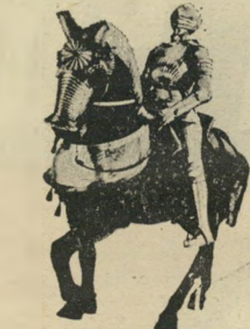
הוא לוקח צ'אנסים

פה! קריאה המביעה גועל־נפש, סיאוב, סלידה. לתקוע נודות במצעד יום־העצמאות? פה! תתביש לך! • היום כבר מתגסקים באמצע הרחוב ואני אומר לכם: פה! להכניס לשון לפה של בחורה זהה — פה! אני מבין אמא, אחות — מישהי מהמשפחה, אבל בחורה זרה — פה! פוסטמה (לאדינו) כינוי גנאי: שפיל, חסר־ערך, פעוט, בווי, מעורר סלידה. הפוסטמה הזה אומר לי אידיטי! פוי־איונוביץ (אידיש) המילה פוץ, כשהיא באה בהדגשה מכוונת. אל תהיה פוי־איונוביץ, תיגש אליו, תדבר איתו, אני בטוח שהוא יבין. פזוונק (תורכית) כינוי גנאי לאדם מעורר סלידה, נבזה. פצ'המצ'ה (אידיש) כסף. חוץ מפצ'המצ'ה אין לו שום דבר בראש.