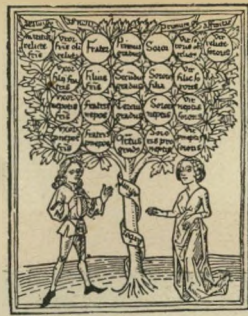
אינעל אבי אביהם

טזטז השמעת קריאת זלזול: טחוז. התחיל ירוחם לסלט בשפמו. פתאום הוא שומע טזטז אדיר מאחד הספסלים האחוריים. טטלה (אירוש), ממושע, מציית בנאמנות. הוא ישלם אצלי כמו טטלה. • כמו טטלה הוא יעשה מה שנגיד לו. טרוניץ כינוי גנאי לאדם טיפש, מטומטם. הדליק גרות חוכה וכמעט שרף ת'בית. הטרונצ'ו הזה. • מה אתה עומד בדלת כמו טרוניץ. תיכנס כבר.