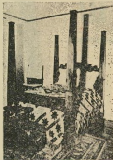
המיטה הזו שווה מיספר

מה איתך? ביטוי הנאמר בעצבנות ומשמעותו: לא נכון, אין הדבר כך! אל תבלבל את מוחי! הפסק לי הציק לי! א: יגאל אלון לא היה בי פלמ"ח בכלל. ב: מה איתך?! • א: אני רוצה לדעת דבר אחד: לקחת את הכסף או לא? ב: מה איתך?! אתה השתגעת? מחלומי (1) כינוי לאדם שיצרנו גבר בו, חושק מאוד. היה חודש בים יורד לחוף מחומם מאוד. (2) רונג, כועס. הם יודעים טוב מאוד למה אני מחומם על ההנהלה. אני עוד לא שכחתי את השיילחנים שלא קיבלתי. מוענטות מונענות את עכוזה בהליכה. קנתה נעליה עם עקבים ויצאה מענטות לרחוב.