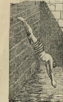
על החיים ועל המוות

קוטר (אידיש) מתלונן, אדם העושה משהו ואחר בוכה ומתאונן, מלא טע'נות. כלב מי שיוצא עוד פעם לפעולה עם הקוטר הזה. קונציניומוציניו (אידיש) ביטוי שפירושו יחס אהבהבים, חיבה מופגנת. קודם היה קוציניומוציניו, ואחר כך לא רצה להסתכל עליה. • עבודה לחדד וקוציניומוציניו לחדד. קרחה (1) בית זונות. נעשתה עצמאית, התגבר שה ופתחה קרחון. (2) איסדר משוער, אנדרלמוסיה. עשה קרחון מהפלוגה, ברדק מזווע.