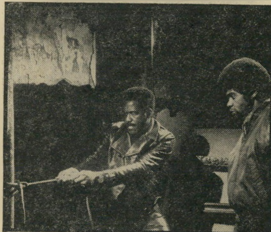
ריצ'ארד ראונדרטי: שחור מדי

כביטו להיתנגשות הגזעית באמריקה, אין ספק שהסרט משקף את הבילבול הקיים ביחסים אלה, ואת חוסר הישע של לבנים ושחורים גם יחד. שאפט עצמו, גיבור הסרט, הוא כושי הגאה בכושיות, אבל נחמד על-ידי קיצוניים שחורים שהוא לבן מדי, ועל-ידי קיצוניים לבנים שהוא שחור מדי. הוא מנצל גופים פוליטיים לשימוש האישי כדי שבסופו של דבר יצליח, בעזרתם, להשאיר את הארלס תחת שלטון שלו. המאפיה הכושית ואת השאר