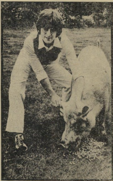
ג'ון לנן שליחות שלום

לנן הצליח למוג מלודיה עם שליחות השלום והאחוה שהוא רוצה למסור בשיריו, ועם כמה מן המיקצבים המקובלים היום, וכל זה בטעם רב ובחוש מוסיקלי שאין להתפלא, כמוכן, על קיומו. מן ההירהור הנוגה של תאר לך, דרך