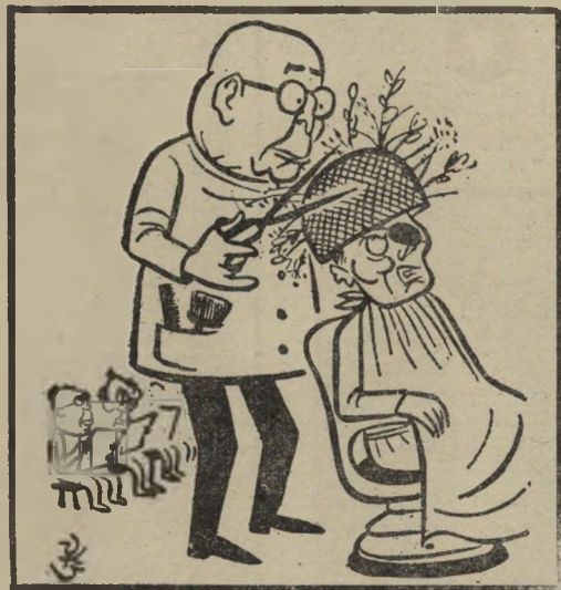
זאב ב, מעריב

זהו כימעת המשך ישיר לתקציב הקיים — ועל כך עירערתי בנאומי. בין השאר אמרתי: