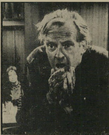
אתור קנדי ב"סתיו אפאלאצי" תקוות שוא

סרט טלוויזיה (יום ד' 29/12, 20.40) סתיו אפאלאצי - דרמה רגילה על משפחה נצרכת בעיר שדה אמריקנית התולה תקוות שוא בהצלחתו האמנותית של הבן הוג, שגילה כשרון נדיר בעבודות קראמיקה. לאהר שכל המשפחה נרתמת לאיסוף כספים על מנת לממן את השתלמו תו בתחום זה, מתנפץ החלום לרסיסים.