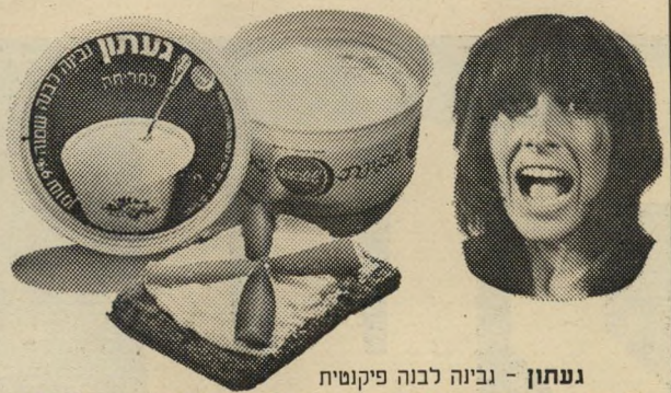
געתון - גבינה לבנה פיקנטית לא יאוסן איך היא משתלבת עם עובייה. ממש משגעת את הנשמה