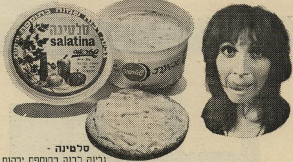
סלמינה - גבינה לבנה בחוספת ירקות. כשאני מורחת על מוסט היא ממש מטריפה את הדעת.