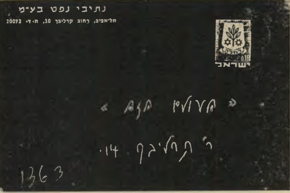
מעטפת מכתב האיום

ל מענה משכועיים עברו מאז הוצתו בזדון משרדי מערכת העולם הזה, והמציתים טרם נתפסו. הידיעה שפורסמה בשבוע שעבר במיספר עיתונים, לפיה אותרו כביכול, מציתי המערכת, לא היה לה שום יסוד. מקורה היה בשגיאת כתיב בדיעה שהועברה על-ידי סוכנות עת"ם. חוסר האונים ואי היכולת של המישרה לעלות על עקבות המציתים, לתפסם ולהענישם, כבר הולידו מיספר תופעות ביניים. חוגים עוינים או בודדים, שאבו ממצב זה עידוד, הרימו ראש והמשיכו במסע של הפחדה ואיומים. כך, למשל, היה צורך להזעיק השבוע את המישרה למשרדי המערכת השרופים, שם נמשכת עבודת המערכת, אחרי שהתקבלה