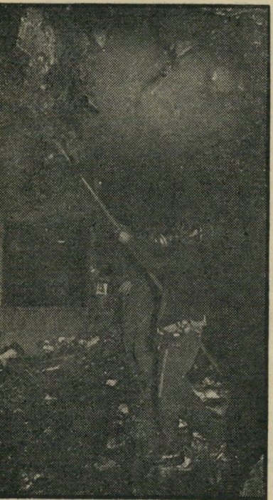
כבאים במערכת "הצופה" אחרי "העולם הזה" —

היה זה אותו הגיון שהניע את המציתים: ההגיון האומר שניתן להלחם בדיעות וב" חופש הבעתן באמצעים אלימים. אין שום זהות, לא אידיאית ולא סגנונית בין ה" מערכות שנסלו קורבן להצתות. להיפך, מערכת הצופה לא היתה בעבר בין ה" מערכות שגינה בהריפות תופעות של אלי" מות בחיים הפוליטיים במדינה. הטענה שהועלתה לפני שבועיים, אחרי הצתת מערכת העולם הזה, כי מי שפותח פתח לאלימות פוליטית, מוציא מהקבוקו שד שקשה להשתלט ולהחזירו לבקבוק — הו" כחה עתה את עצמה.