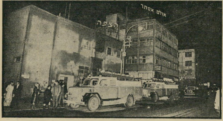
השריפה במערכת "הצופה" גם "העולם הבא" —

בעוד שירותי הביטחון כימעט ואינם משאירים פיגוע ביטחוני אחד, מבלי ל" גלות את מבצעיו במקום או במאוחר ול" הביאם על עונשם, מתגלה המישרה יו" תר ויותר כמוסד מעורר רחמים, שאינו מסוגל לבצע את התפקידים המוטלים עליו. פמיני דרך לכריה. לא רק פצצות באוטובוסים או רימונים בפחיאשפה כי רחובות הערים הם עניין ביטחוני. גם פגיעה בחופש העיתונות והביטוי מסכנת את הבטחון החברתי במדינה. האלימות — הסכנה החברתית הפנימית, מאיימת כיום על החברה הישראלית ה" בה יותר מאשר הסכנה הביטחונית התי" צונית. אם לא ידעו השלטונות להשתלט עליה בעוד מועד, להקדיש לדיכוייה את מירב המשאבים הכלכליים והאנושיים, עלולות הדליקות שהוצתו בודון בעמרי" כות העולם הזה והצופה להוות סימני-דרך לכליה חברתית וחברתית.